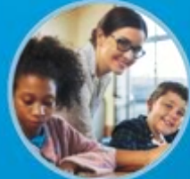
መራሒ Academic Skills Center ናይ ምሉእ-ግዜ ሓውሲ-ሞያተኛ