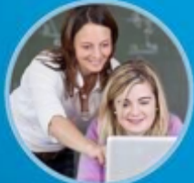
ምስክር ወረቐት ዘለዎ ሓጋዚ መምህር $35 ንሰዓት

DCSD፡ ኣብ መዓልቲ ትምህርቲ ንተማሃሮ ሓጋዚ ዚኮነ ትምህርቲ ዚህቡ መምሃራን የናዲ ኣሎ። Academic Skills Centers፡ ኣብ ዓውድታት ቍጽጽ፡ መሰረታዊ ትምህርቲ ንባብን ጽሕፈትን፡ ስነ-ጥበብ ቛንቋን ወሳኒ ክእለታት ትግባረን ዚተኮረ ልዑል ዝዓቕኑ ሓጋዚ ትምህርቲ ን20 ቦታታት ኣብያተ-ትምህርቲ መባእታን ማእከላይ ደረጃን Horizon ይህቡ። ሎም መዓልቲ ኣመልክቱ፣ ቃለ-መገባት ንምግባር ንኣብያተ-ትምህርቲ ተወከሱ።