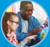
ምስክር ወረቐት ዘይብሉ ሓጋዚ መምህር $18 ንሰዓት