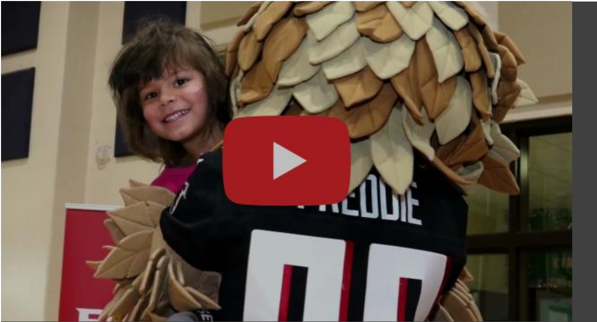
Falcons Friday at Peachcrest Elementary School https://www.youtube.com/watch?v=_J4UnJi-6X0