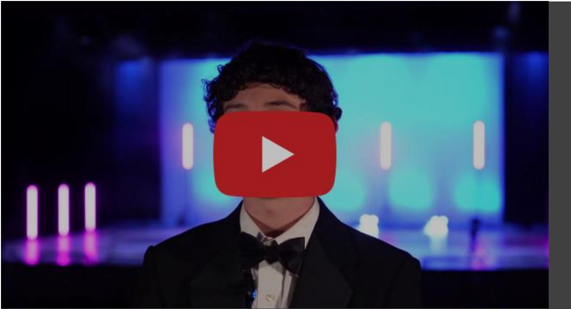
DCSD Music Matters (Episode 7) Lakeside High School

https://www.youtube.com/watch?v=3vQ1pE-jS_s